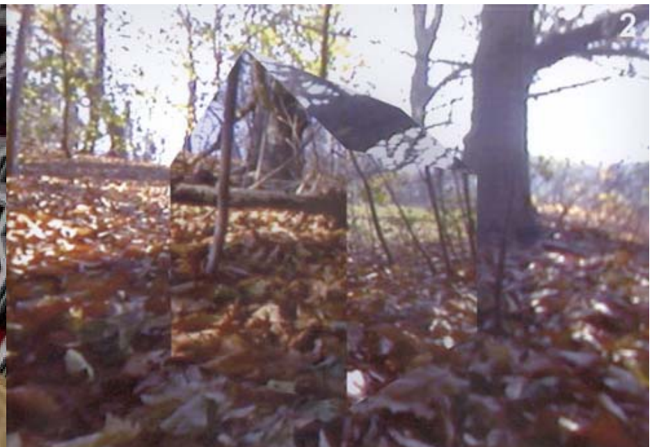
Haluk Akakçe, immagine tratta da Still life (video, 2002)